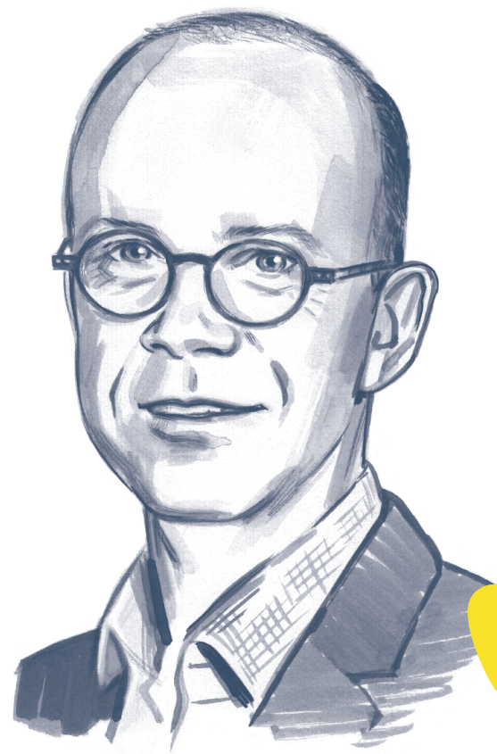
Olivier Dauterive Président de la Chambre Régionale d'Agriculture des Hauts-de-France